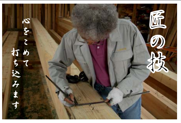
一本一本手作業で丁寧に仕上げます