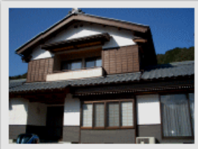
和風から洋風住宅まで